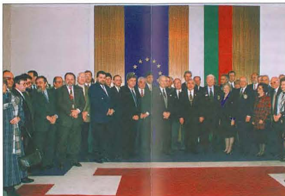
Президентството - участниците ротарианци на д-р Желю Желев.