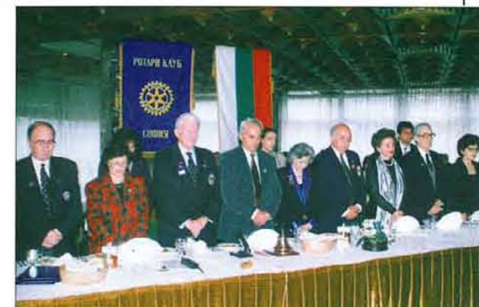
Традиционната ротарианска молитва.