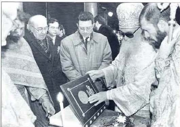
На 23 февруари с тържествен водосвет бе осветен „Консорциум 2000“.

на Пловдив, като под елит се имат предвид хора, които са на управленчески и стратегически длъжности в Пловдив, или бизнесмени, спечелили парите си по законен път, с които да могат да участват в общественополезни инициативи. На тези баловете ще се канят представители на различни обществени групи и слоеве, например юристи, известни личности от сферата на здравеопазването, науката, образованието, бизнеса, държавния и частния сектор, ръководители на структуроопределящите предприятия за икономическата картина на града, на общинската администрация, на политическите партии. Идеята е „Пловдивски вечери“ да бъдат място, където тези хора да могат да общуват и да контактуват помежду си в неформална обстановка. Предвижда се тези баловете да се провеждат в края на всеки месец.