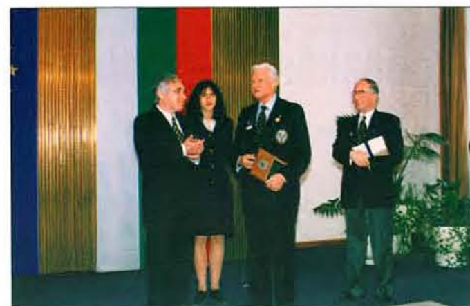
Президентът на РИ Хърбърт Браун произнася словото си.