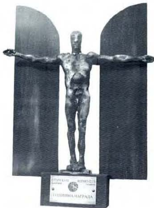
Пластиката, дело на скулптора Стефан Лютаков